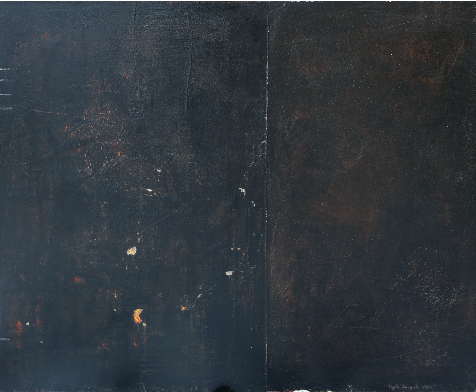
Sigita Daugule. BRŪNS / BROWN

audekls, eļļa, jaukta tehnika / oil on canvas, mixed media, 120 x 150 cm, 2010