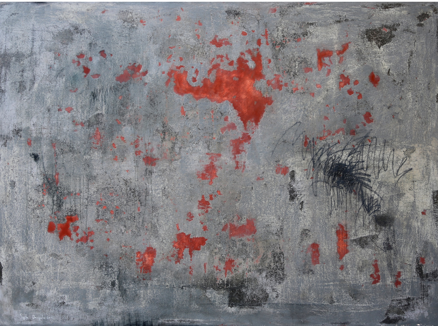
Sigita Daugule. NEKAS / NOTHING audekls, eļļa / oil on canvas, 180 x 250 cm, 2012