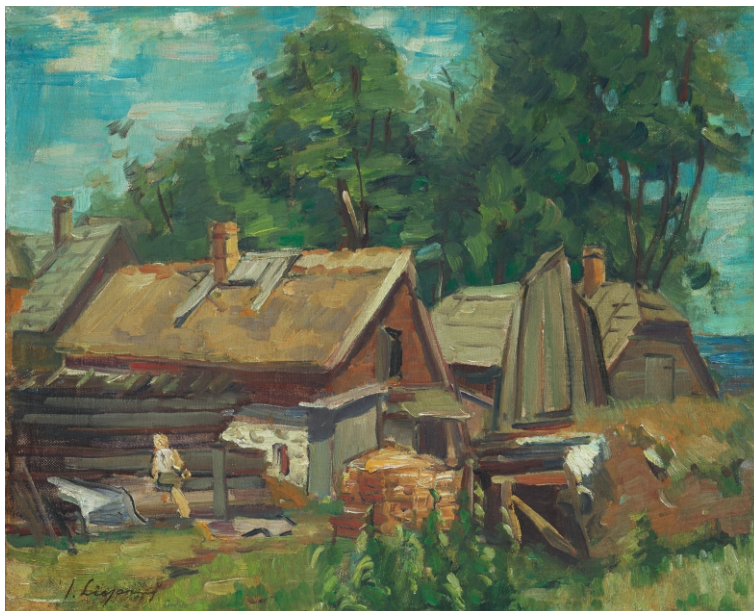
Jānis Liepiņš. KAUGURCIEMA ZVEJNIEKU SĒTA / FISHERMAN'S FARMSTEAD IN KAUGURCIEMS audekls, eļļa / oil on canvas, 40,6 x 50,7 cm, 20.gs. 30. gadu vidus / Mid-1930's Zuzānu kolekcija / Zuzān's collection