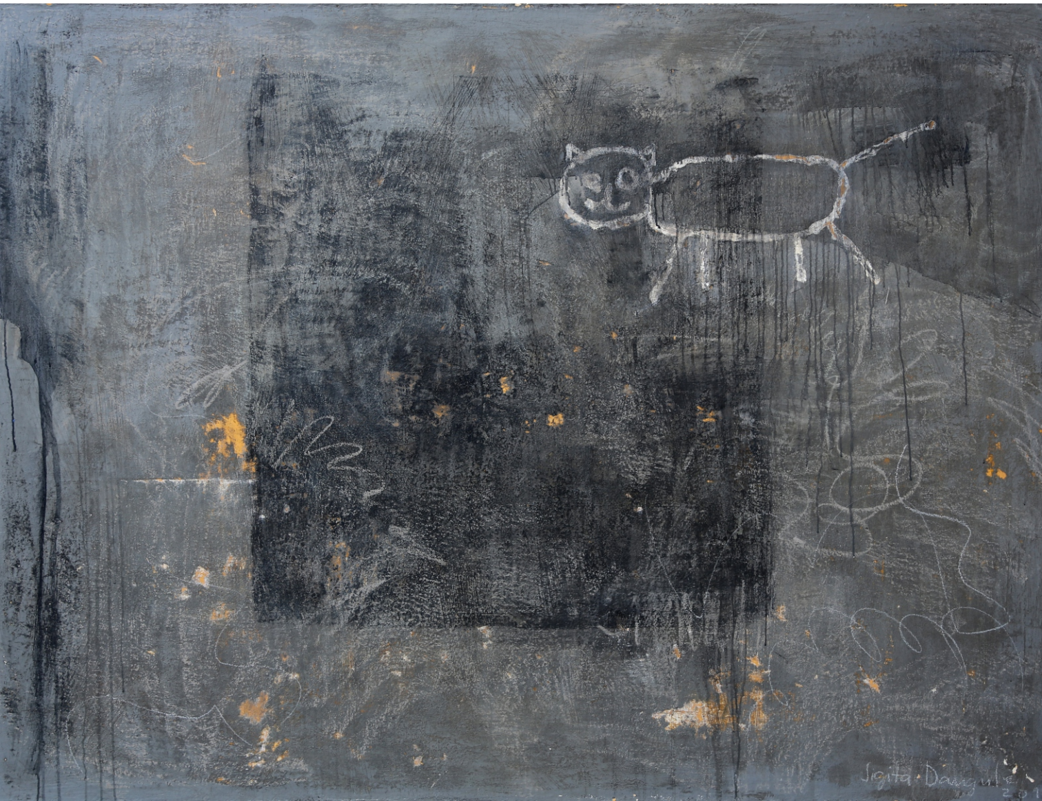
Sigita Daugule. KAĶIS / THE CAT audekls, eļļa / oil on canvas, 135 x 180 cm, 2011