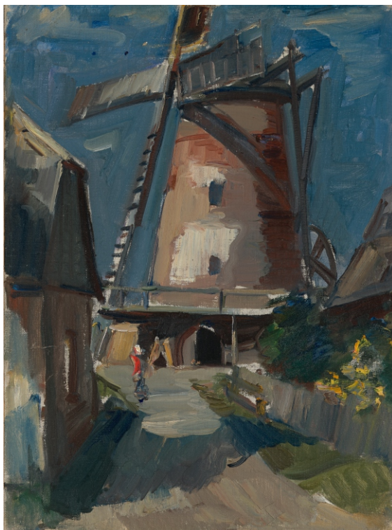
Jānis Liepiņš. DEGOLES DZIRNAVAS / THE WINDMILL OF DEGOLE audekls, kartons, eļļa / oil on canvas and cardboard, 70 x 51,5 cm, 1942 Zuzānu kolekcija / Zuzān's Collection