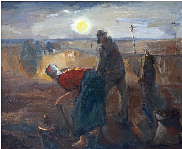
Jānis Liepiņš. VAKARS / EVENING audekls, eļļa / oil on canvas, 81 x 100 cm, 1940 Belēviču kolekcija / Belēvičs collection