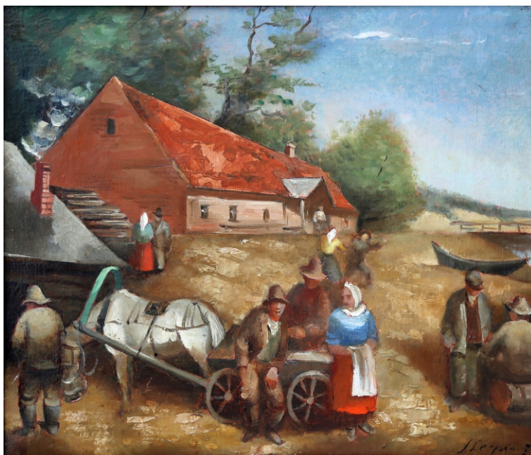
Jānis Liepiņš. PIE KROGA / AT THE INN audekls, eļļa / oil on canvas, 42 x 50,3 cm, 1931 Privātkolekcija / Private collection

← Sigita Daugule. SIENA / THE WALL audekls, eļļa / oil on canvas, 150 x 111 cm, 2012