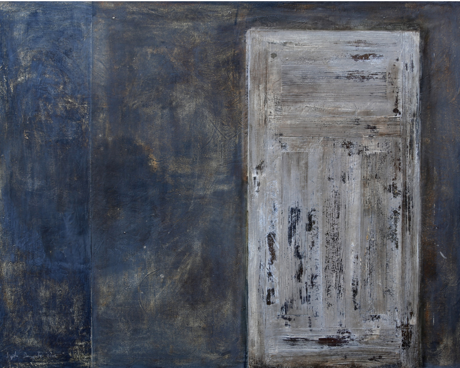
Sigita Daugule. DURVIS / THE DOOR audeklis, eļļa / oil on canvas, 125 x 162 cm, 2011