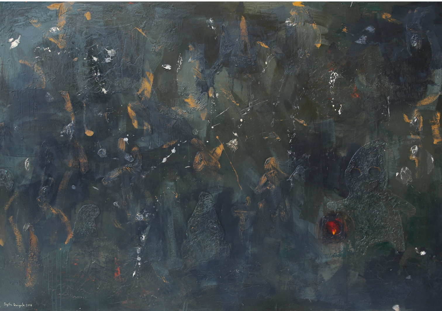
Sigita Daugule. DĀRZA RŪĶU DĀRZA SVĒTKI / A GARDEN PARTY OF GARDEN GNOMES audeklis, eļļa / oil on canvas, 150 x 220 cm, 2016