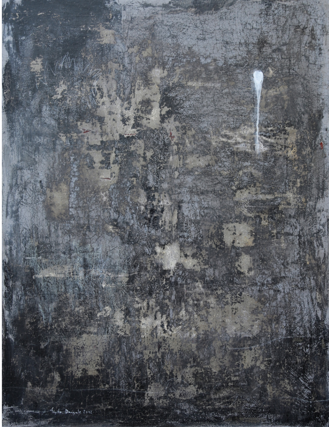
Sigita Daugule. ZĪRIŅI LIDO / TERNS ARE FLYING audekls, eļļa / oil on canvas, 180 x 135 cm, 2012