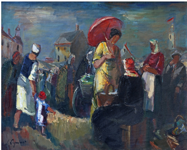
Jānis Liepiņš. TIRGŪ / IN THE MARKET audekls, eļļa / oil on canvas, 72 x 92 cm, 1940 Belēviču kolekcija / Belēvičs collection