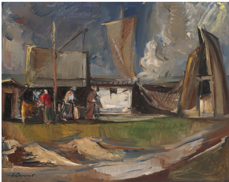
Jānis Liepiņš. PIEJŪRAS CIEMATĀ / IN THE SEASIDE VILLAGE audekls, eļļa / oil on canvas, 73 x 92 cm, 20.gs. 30. gadi / 1930's Zuzānu kolekcija / Zuzān's Collection