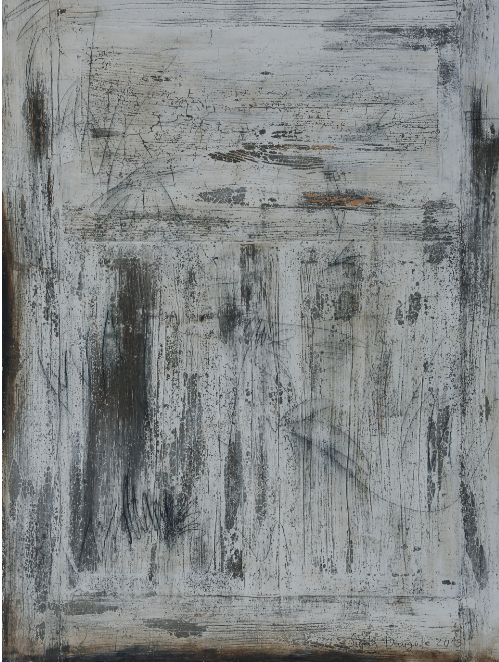
Sigita Daugule. DURVIS / THE DOOR audekls, eļļa / oil on canvas, 150 x 111 cm, 2013 Zuzānu kolekcija / Zuzān's collection