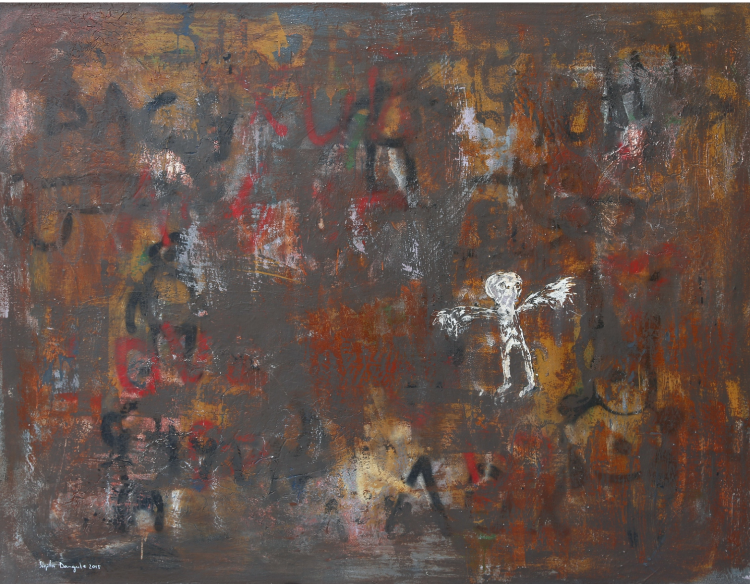
Sigita Daugule. ENĢELIS / AN ANGEL audeklis, eļļa / oil on canvas, 135 x 180 cm, 2015