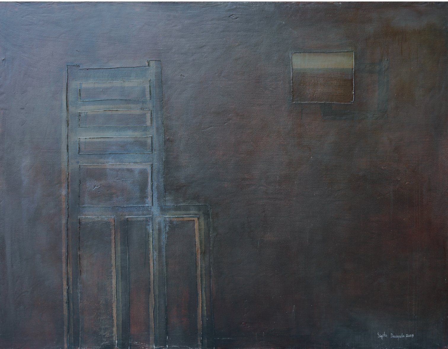
Sigita Daugule. KLUSĀ DABA AR KRĒSLU UN AINAVU PIE SIENAS / STILL LIFE WITH A CHAIR AND A LANDSCAPE ON THE WALL audekls, eļļa, jaukta tehnika / oil on canvas, mixed media, 136 x 180 cm, 2008