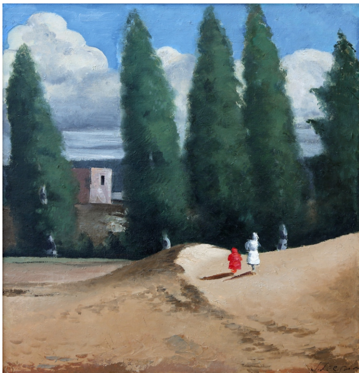
Jānis Liepiņš. AINAVA. ŠAMPĒTERA IELA / ŠAMPĒTERA STREET audekls, eļļa / oli on canvas, 64 x 61,8 cm, 1926 Privātkolekcija / Private collection