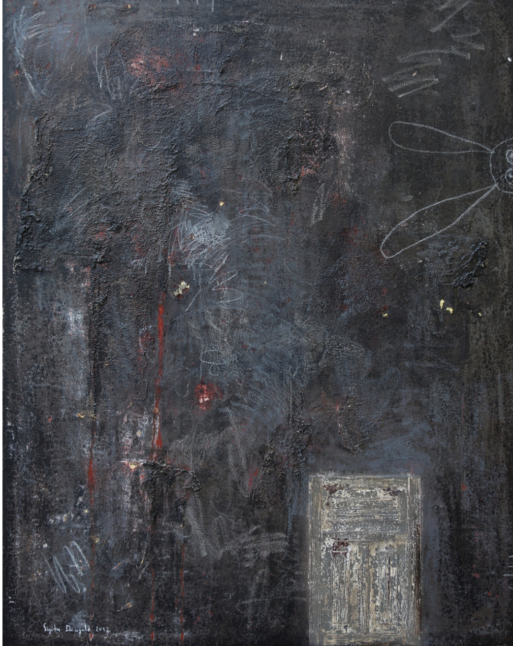
Sigita Daugule. DURVIS BALTAJAM TRUSIM / THE DOOR FOR WHITE RABBIT audekls, eļļa / oil on canvas, 160 x 125 cm, 2012