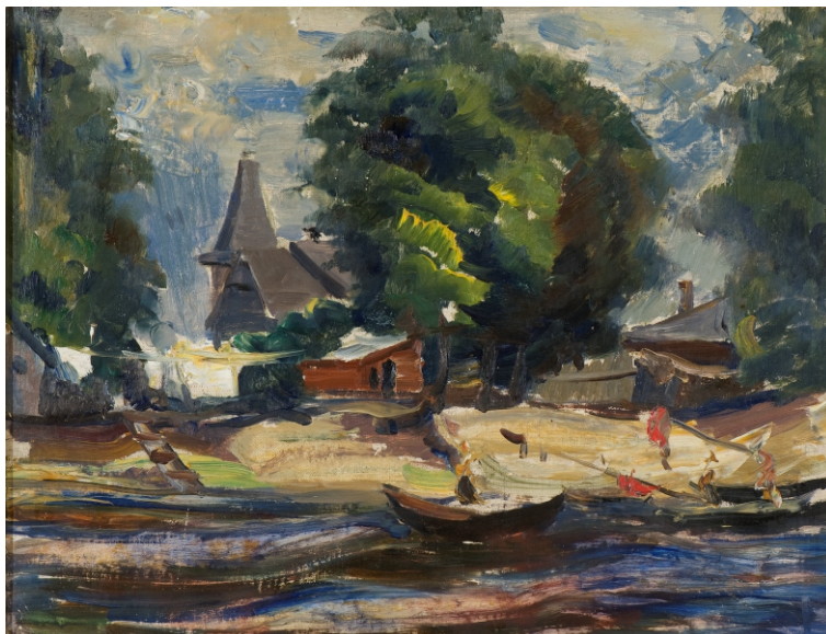
Jānis Liepiņš. UPES MALĀ / ON THE RIVERSIDE audekls, eļļa / oil on canvas, 49 x 63 cm, 1930/1940 Zuzānu kolekcija / Zuzān's collection

Sigita Daugule. SIENA / THE WALL → audekls, eļļa / oil on canvas, 135 x 140 cm, 2004